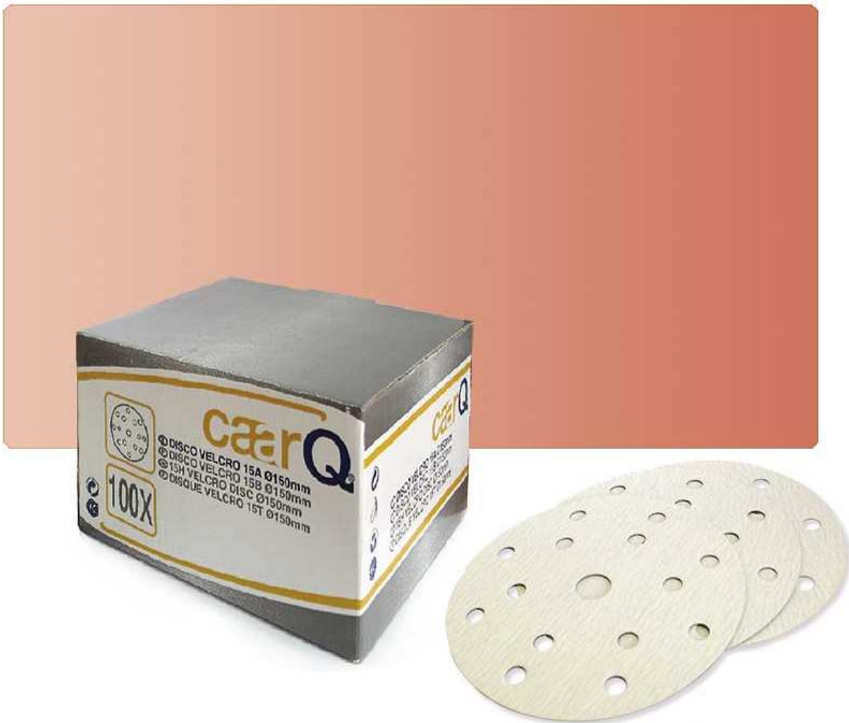
Discos Velcro 15H Ø150mm caarQ